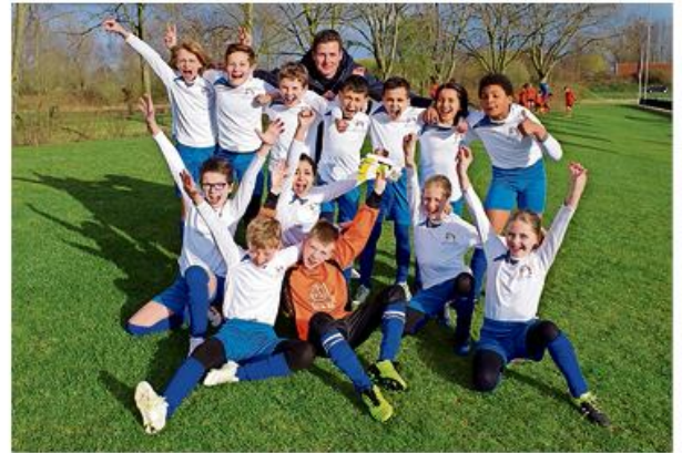
Montessori Aan de Basis doet vrolijk mee aan het schoolvoetbaltoernooi.

Montessori Aan de Basis heeft in aanloop naar het toernooi slechts twee keer met elkaar getraind. Toch zijn ze vol enthousiasme aan het toernooi begonnen. Ze zijn ingedeeld in poule A, waar iedereen van elkaar kan winnen. Het is te zien dat ze voor elkaar door